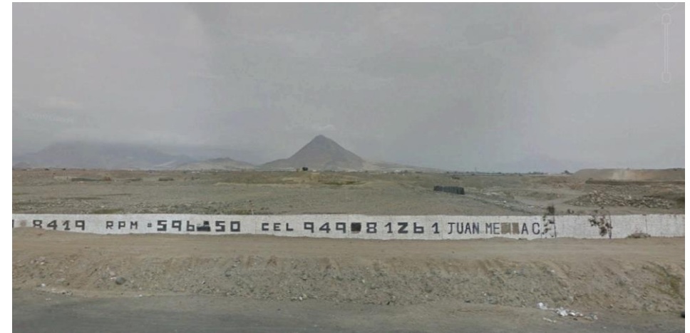
Frente del terreno