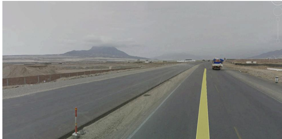
Vía de acceso desde la Panamericana