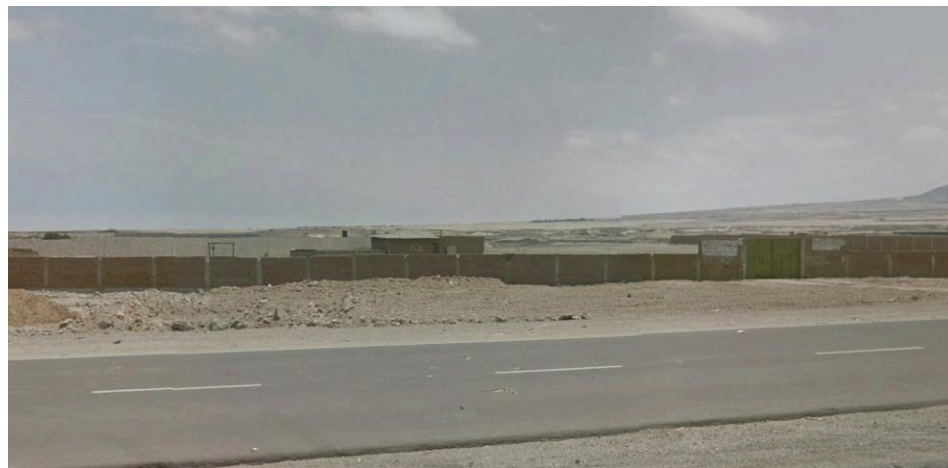
Terreno colindante (izquierda)